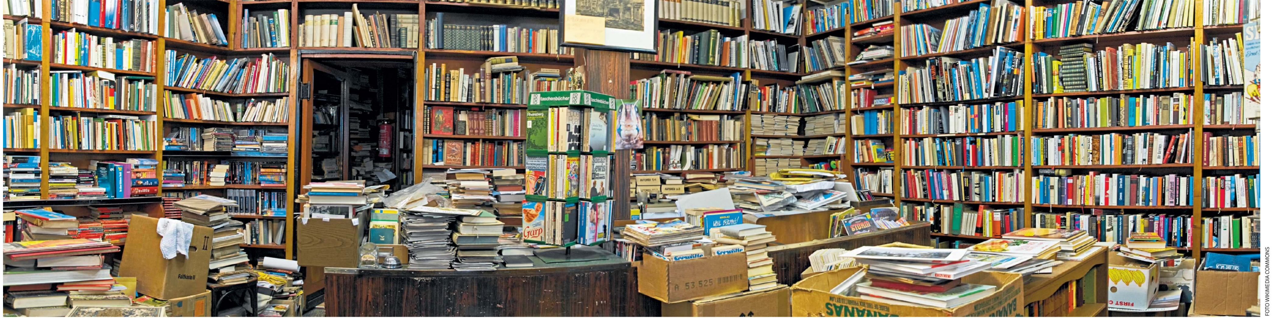
Planken en dozen vol boeken. Dat is het cliché van de geesteswetenschappen. Maar in werkelijkheid hebben de alfa-wetenschappen wel degelijk geld, studenten én een verhaal.